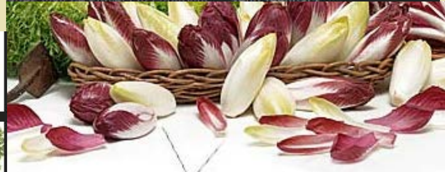
Red and White California Endive